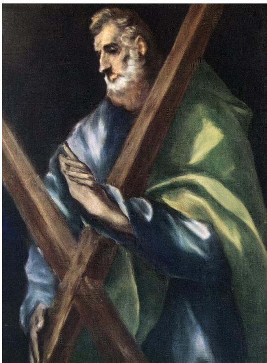
Sf Andrei, pictura El Greco