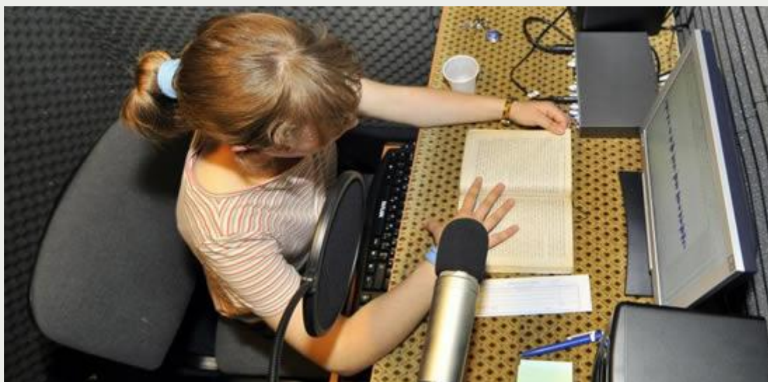
Inregistrarea unei carti audio DAISY in studio

Fundatia "Cartea Calatoare" foloseste acest standard pentru a produce peste 30 de carti anual . In cazul cartilor de beletristica sau a manualelor scolare pentru copii, textul se inregistreaza in studio, cu voce umana, iar textele de specialitate sunt redade cu un soft de sinteza vocala.