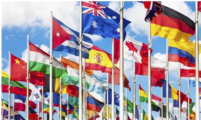
24 octombrie Ziua ONU"

În 1971, Adunarea Generală ONU a recomandat că Ziua Națiunilor Unite să devină pentru toate statele membre sărbătoare publică.