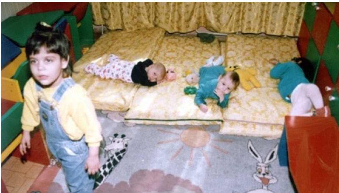
Copiii nu vor mai putea fi instituționalizați înaintea vârstei de 3 ani

Camera Deputaților a adoptat, miercuri, 17 septembrie 2014, cu 336 voturi ”pentru” și o abținere, proiectul de lege care prevede prelungirea de la 2 la 3 ani a vârstei copiilor care pot beneficia de plasament exclusiv în familia extinsă sau substitutivă, fiind interzis plasamentul acestora în regim rezidențial.