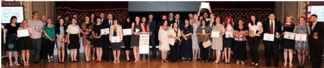
Castigatorii celei de-a XII-a editii a Galei Societatii Civile

Pe 10 iunie, la Ateneul Roman, a avut loc festivitatea de premiere a celei de-a XII-a editii a Galei Societatii Civile . Castigatorii au fost alesi dintr-un total de 147 de proiecte inscrise de ONG-uri si grupuri de initiativa.