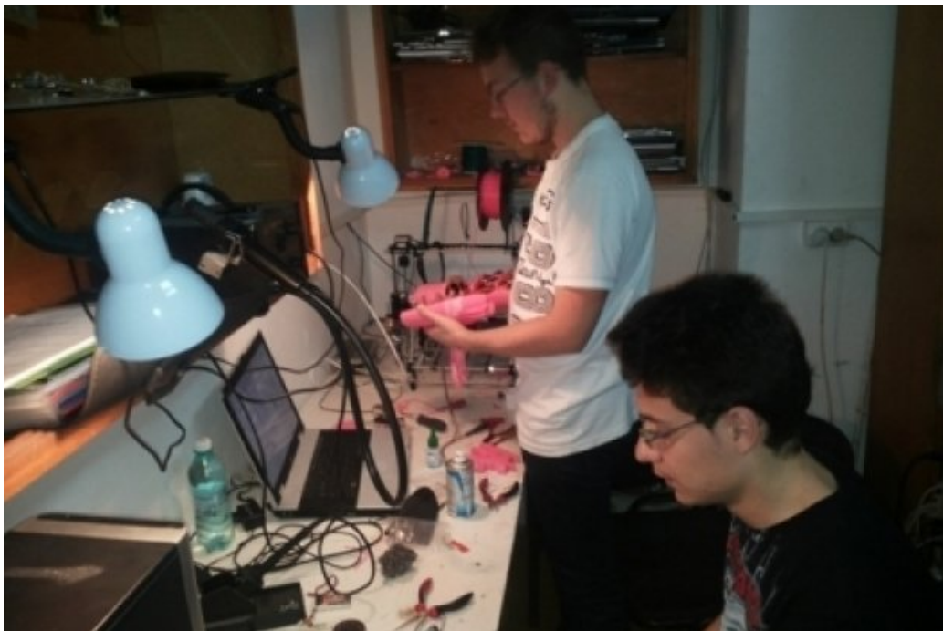
Elevii din Botoșani au creat un braț robotic humanoid

Mai mulți elevi din Botoșani, coordonați de un profesor de la Palatul Copiilor din Botoșani, au creat un braț robotic humanoid. Performanța a fost realizată în perioada 15 aprilie - 15 iunie 2014, în cadrul unui proiect derulat de Direcția Județeană pentru Sport și Tineret și Palatul Copiilor.