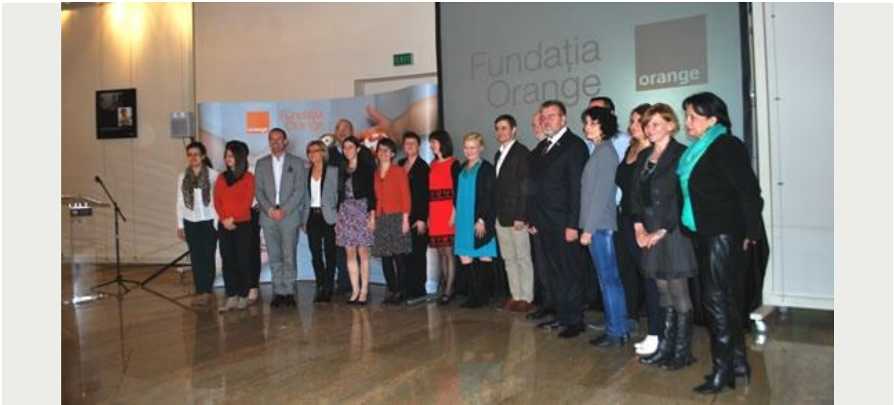
Castigatorii competitiei 'Lumea prin culoare si sunet', 2015