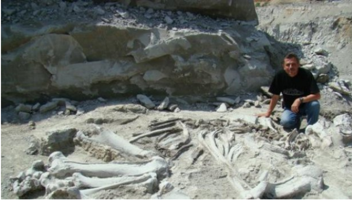
Fosila unei noi specii de mamifer, descoperită lângă Alba-Iulia

Descoperirea a fost făcută publică printr-un articol apărut în prestigioasa revistă "Comptes Rendus Palevol", care este editată la Paris, potrivit unui comunicat de presă emis de Universitatea Babeș-Bolyai.